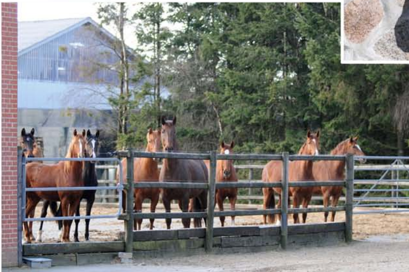
Noen av unghoppene på Blae Hors